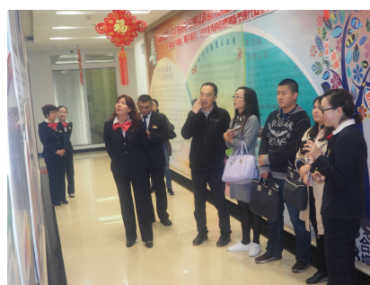
检查组一行到昆明滇池支行调研

下一步工作中,我行将以此次综合督查调研为契机,正视督查调研中发现的问题和不足,认真贯彻落实省国资委