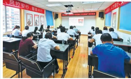
西山支行 五华支行