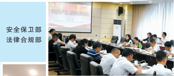
安全保卫部 法律合规部