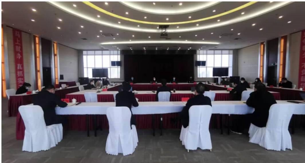
2月12日,我行召开疫情防控领导小组第三次会议